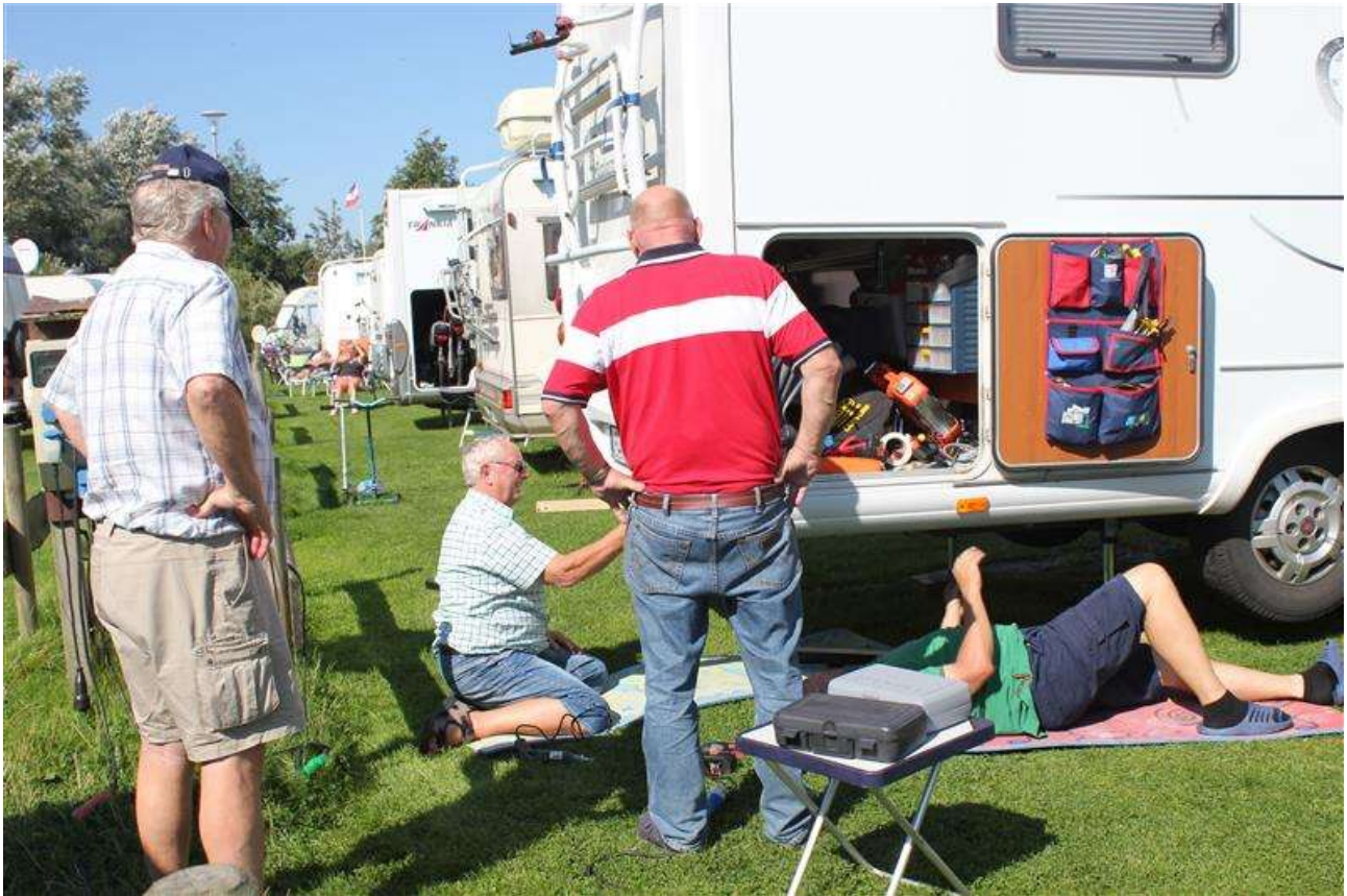
Holderen bliver monteret

Holderen er lavet så den stikker 2 cm ud af bagskærmen. Der er tætnet med marine sealer.